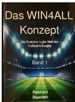
Abb. 4.Auflage 2024